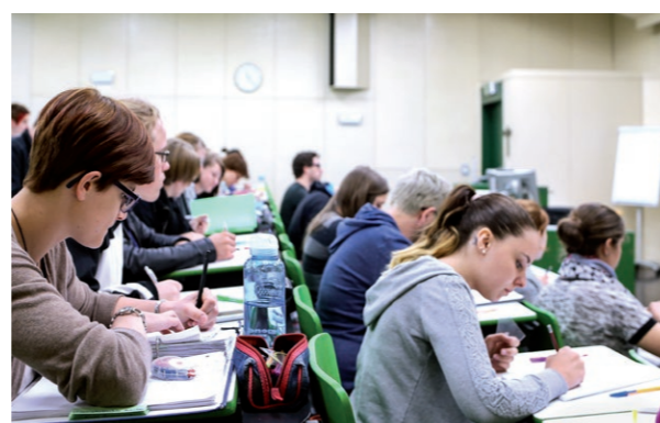
Private Pädagogische Hochschule der Diözese Linz