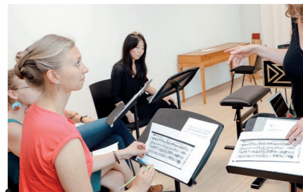
Anton Bruckner Privatuniversität

LiLeS Service-Center Hauptplatz 6 4020 Linz