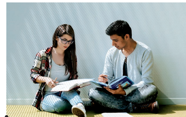
JKU Johannes Kepler Universität Linz