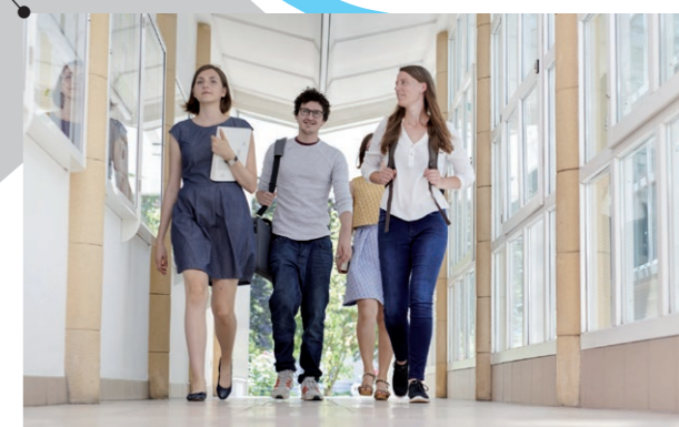
Katholische Privat-Universität Linz