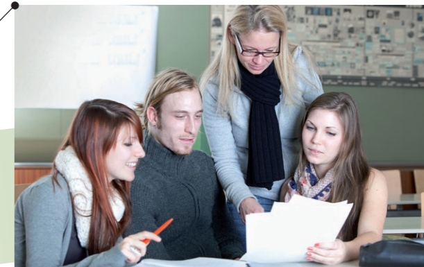
Pädagogische Hochschule Oberösterreich